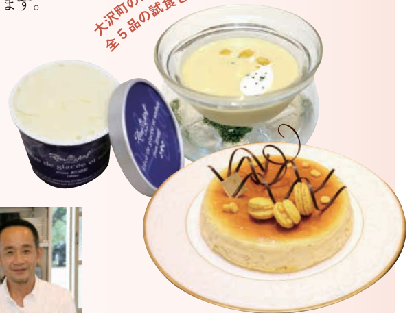
(司会進行) 関西スイーツ 株式会社 CUADRO 代表 三坂 美代子